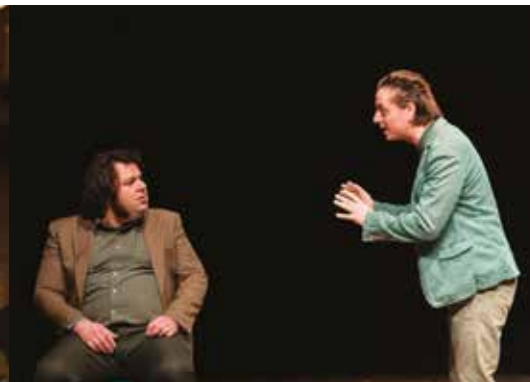
QUESTA SPLENDIDA NON BELLIGERANZA VENERDÌ 18 FEBBRAIO