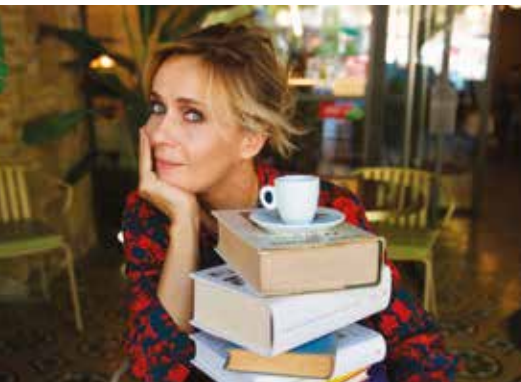
SMARRIMENTO DOMENICA 30 GENNAIO