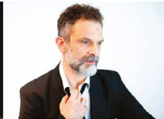
STORIE DI TANGO SABATO 19 MARZO