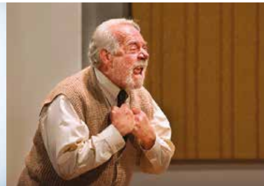
L'UOMO LA BESTIA E LA VIRTÙ SABATO 9 APRILE