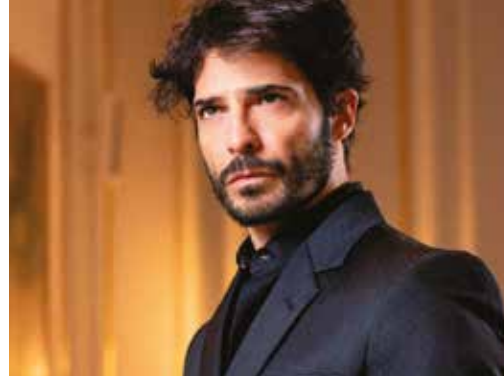
LO ZINGARO VENERDÌ 5 NOVEMBRE