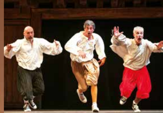
LE OPERE COMPLETE DI SHAKESPEARE IN 90' VENERDÌ 10 DICEMBRE