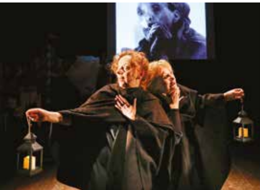
L'ANELLO FORTE MERCOLEDÌ 9 MARZO, ORE 21