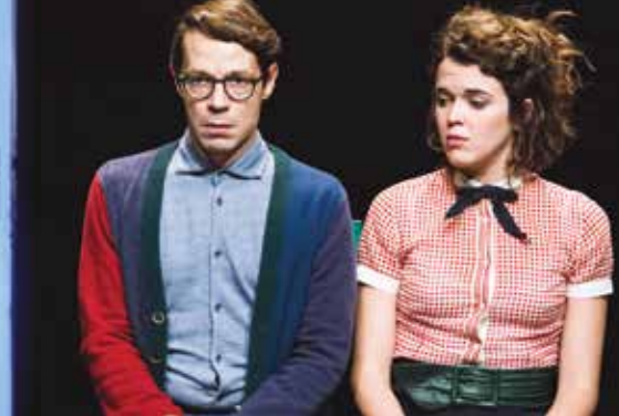
BOLLE DI SAPONE VENERDÌ 22 APRILE, ORE 21