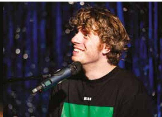
UNO SPETTACOLO DIVERTENTISSIMO CHE NON FINISCE ASSOLUTAMENTE CON UN SUICIDIO DOMENICA 27 MARZO, ORE 18