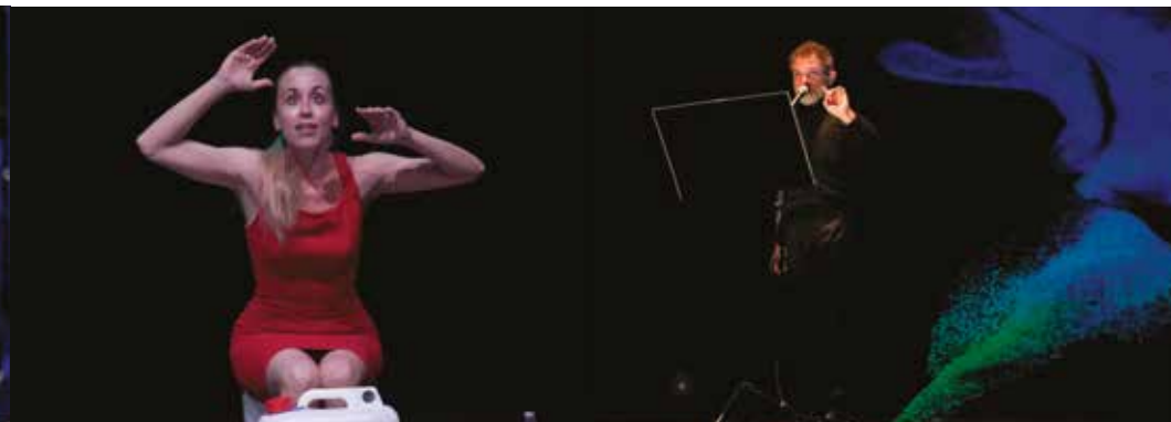
MIO PADRE NON È ANCORA NATO VENERDÌ 6 MAGGIO, ORE 21